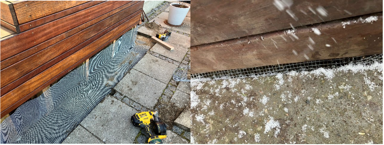
Sikring af trappen på siden, med efterfølgende monteret bræt.