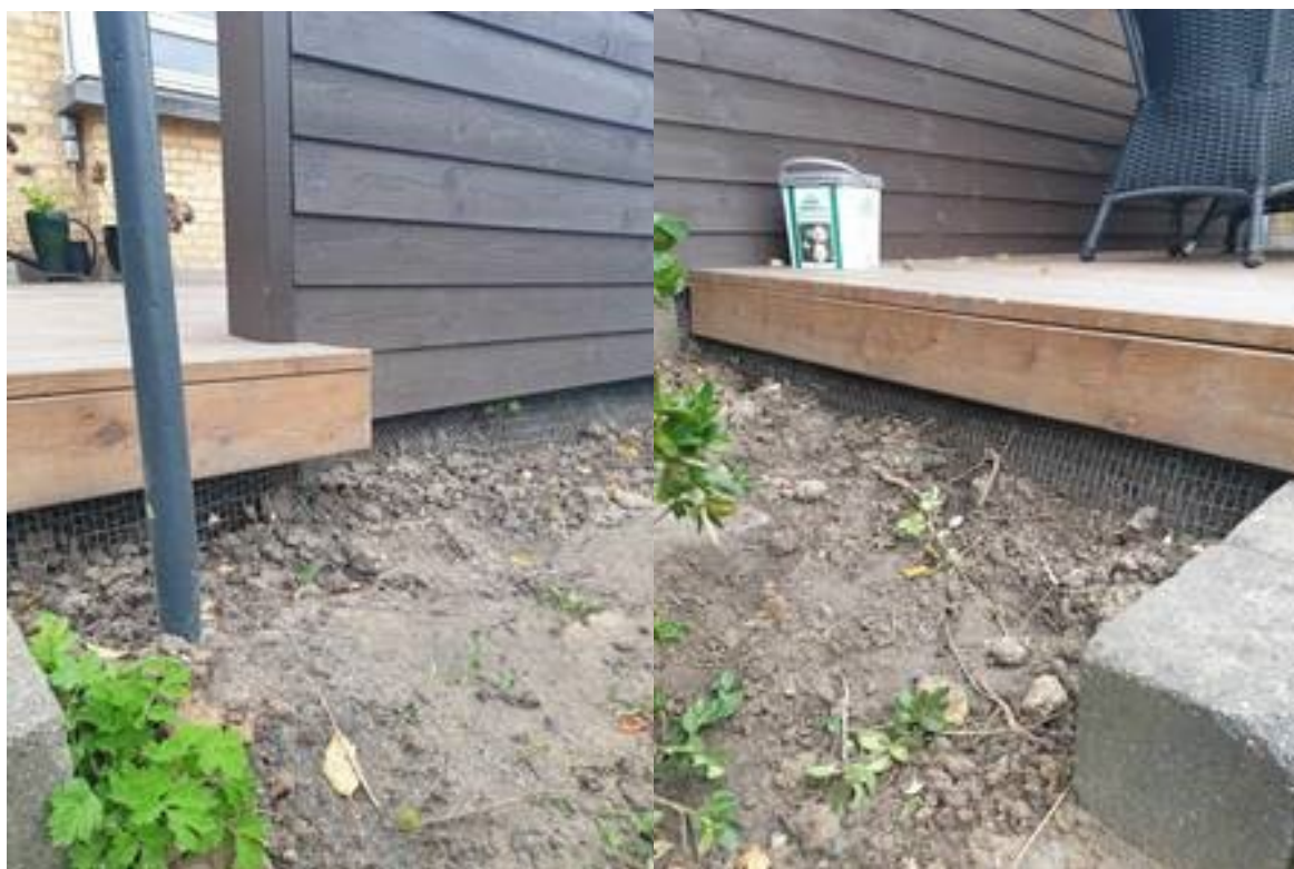
Sikring rundt om træterrassen.