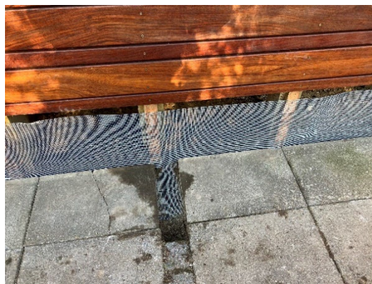
Sikring af siderne på trappen