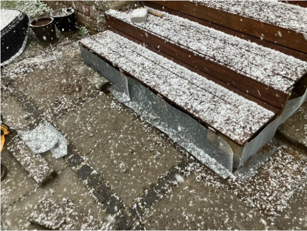
Sikring af de enkelte trappetrin, der er efterfølgende monteret bræt.