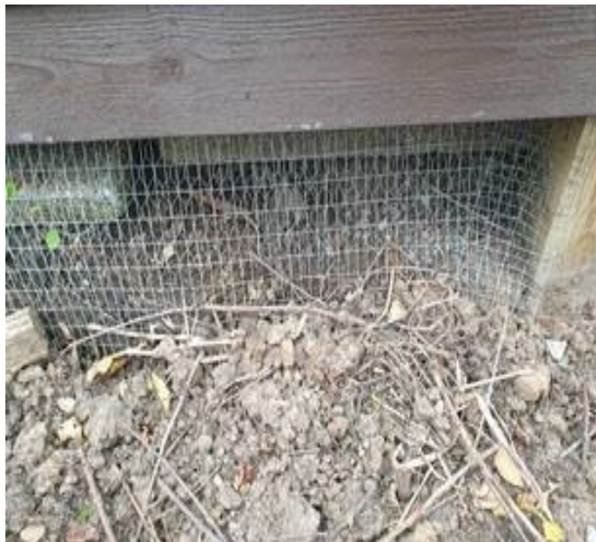
Sikring langs husmuren.