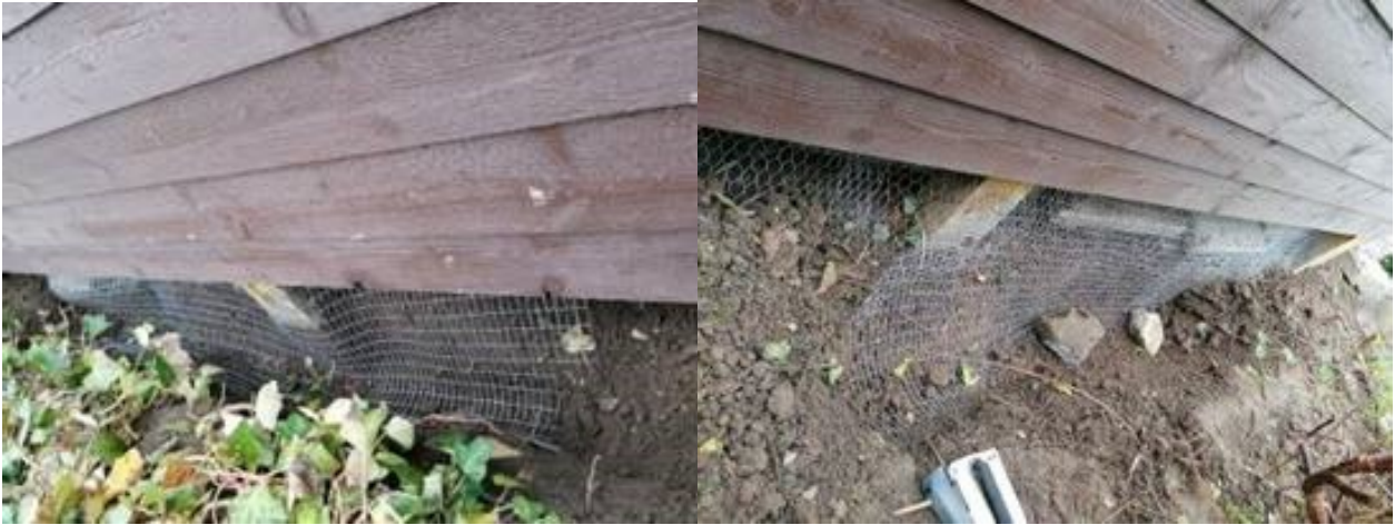
Sikring rundt om træterrassen.