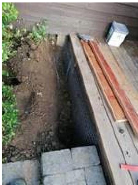
Sikring langs husmuren.

Sikring af en almindelig træterrasse direkte på stenbelægningen, der var stor rotteaktivitet under terrassen.