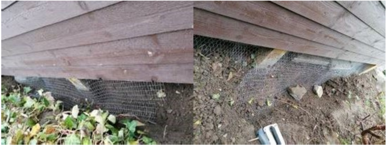
Sikring rundt om træterrassen.