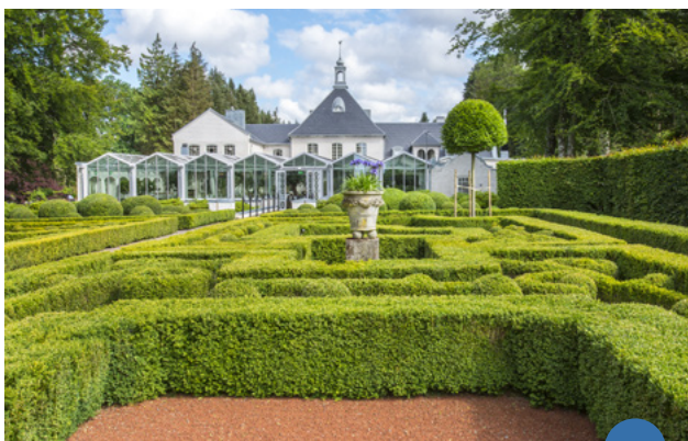
I Sverige kan du få en botanisk oplevelse i haveanlægget Norrvikens Trädgårdar.