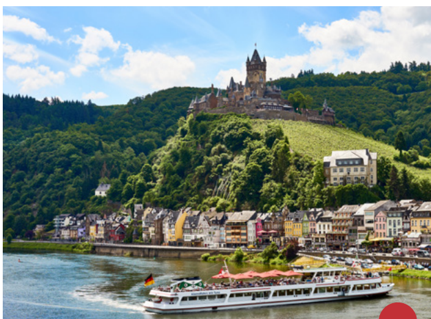
Turen til Rudesheim am Rhein byder på en smuk sejltur på Rhinen.