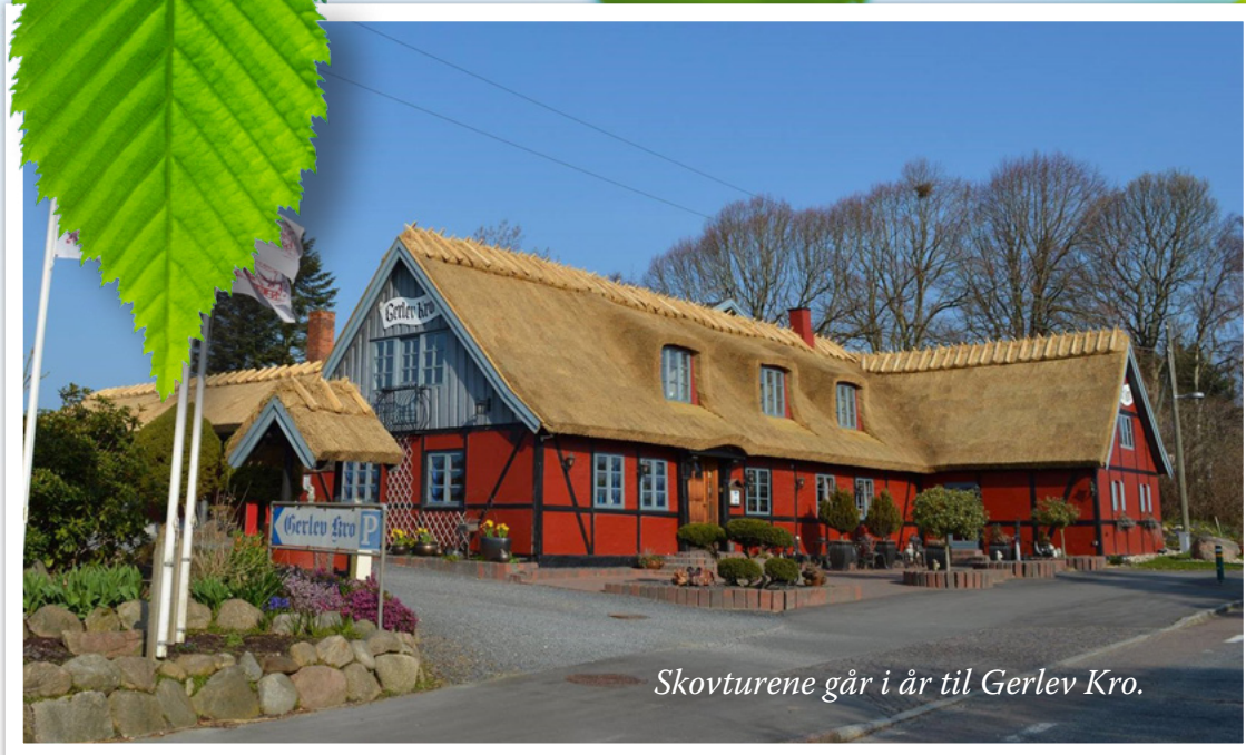
Skovturene går i år til Gerlev Kro.

på de personer, du køber billetten til. Det er et krav, at de skal være pensionister i Gladsaxe Kommune.