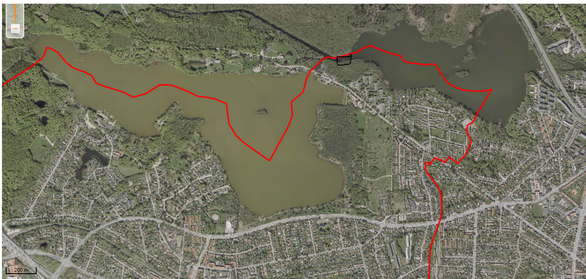
Oversigtskort over Bagsværd Sø og Lyngby Sø med Mølleåkanalen. Den sorte firkant angiver anløbsbroens placering. Den røde streg er kommunegrænsen mellem Gladsaxe og Lyngby-Taarbæk Kommune.