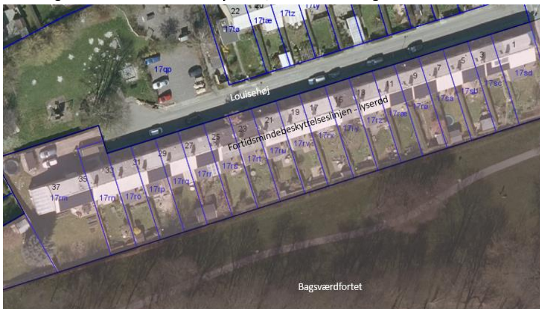
Figur 1. Louisehøj nr.1-37 med lyserød fortidsmindebeskyttelseslinje

Rækkehusbebyggelsen der er beliggende på Louisehøj 1-37, 2880 Bagsværd er opført i 1952. Afgørelsen vedrører Louisehøj nr. 23, matr.nr. 17rt Bagsværd.