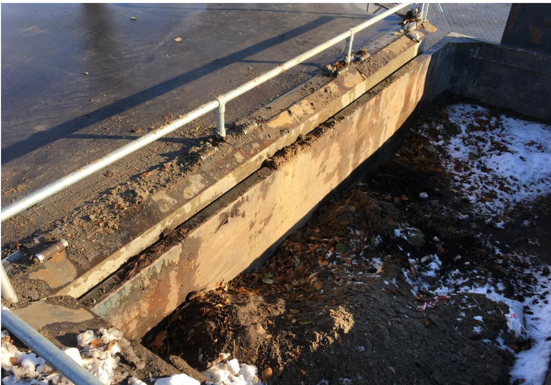
Rækværk af den lave type (forslag A) på Hillerød Genbrugsstation.