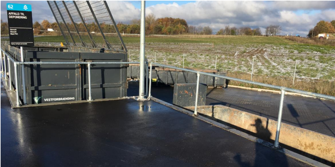
Rækværk af den høje type (forslag B) på Hillerød Genbrugsstation.