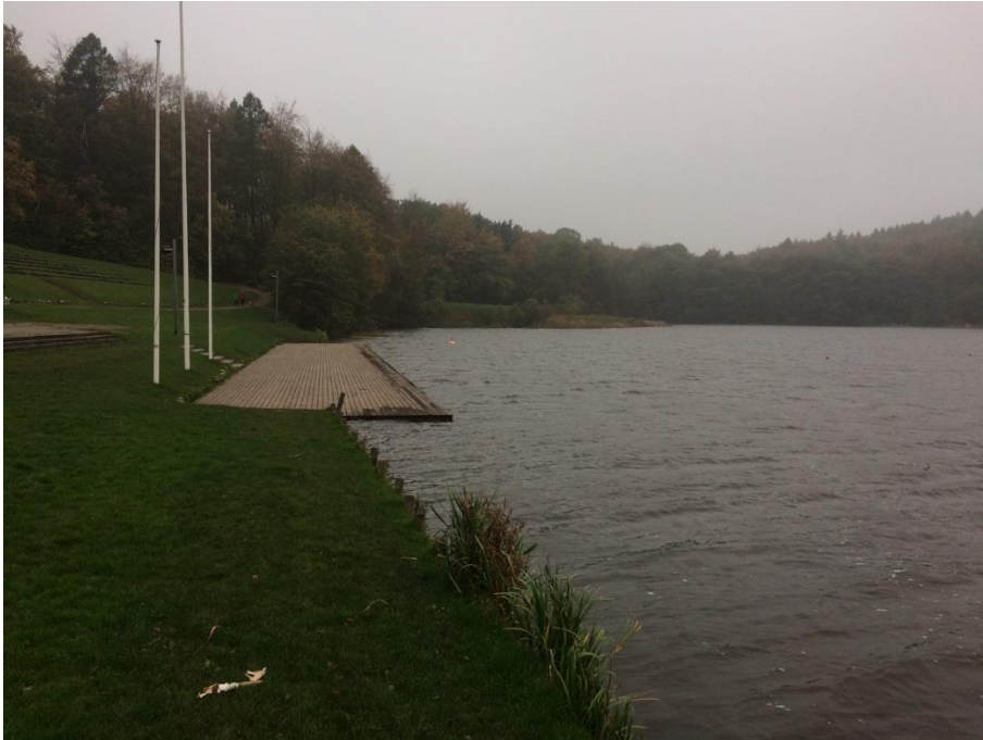
Den eksisterende præmiebro set mod vest

Præmiebroen nedlægges og det underliggende areal graves væk ved projektet. Der er et lille udløb/dræn lige midt for broen.