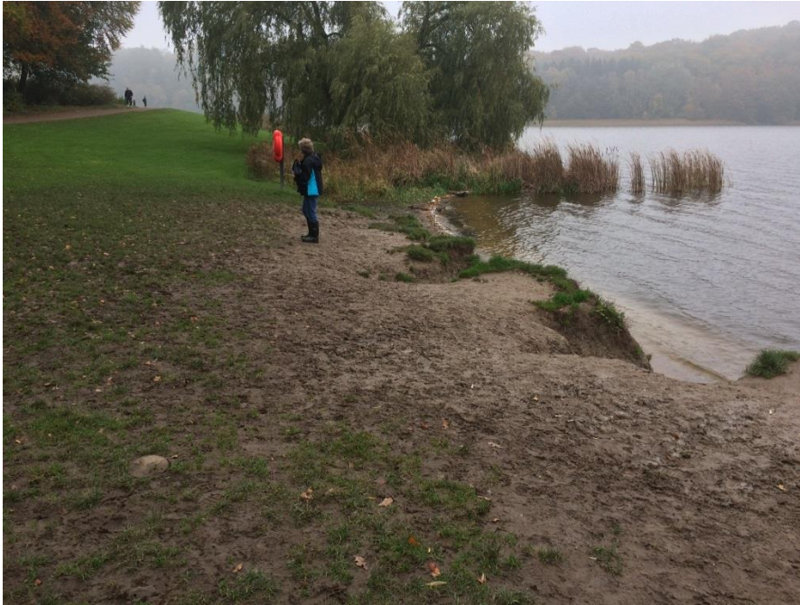
Bugten ved Krathus, hvor den nye anløbsbro for Bådfarten ønskes placeret