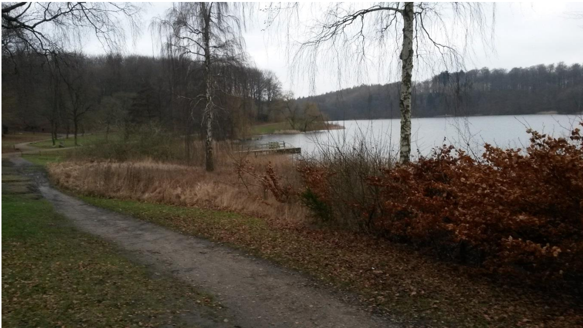
Billede fra syd over bådfartens bro, set mod området foran Krathuset.

Bådfartens bro ligger i dag let skjult af rørskov. Den går ca. 5 m på land med små grustrin fra langsgående sti ned til broen. Her er desuden et rækværk. Broen er i pæn stand og har platform med bænk. Bro og sti fjernes i forbindelse med projektet.