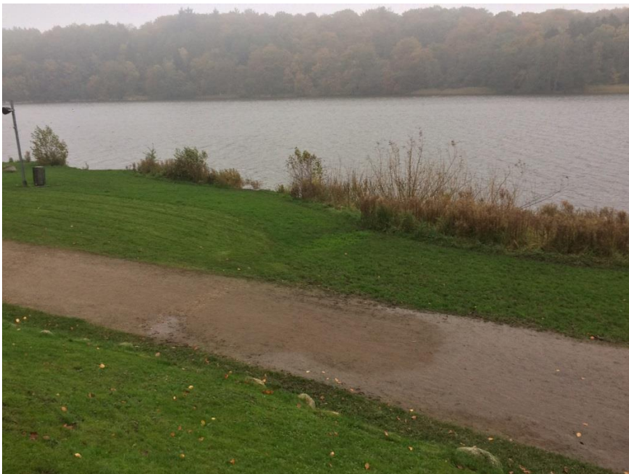
Brinken ved tribunerne, hvor den nye præmiebro ønskes placeret Den smalle fordybning ved tribuneområdet, hvor vandet der løber over stien løber videre

Den nye præmiebro anlægges lidt længere mod øst, udenpå en rørskov, der her består af en smal brink med rød el og pileopvækst, dunhammer og lodden dueurt mm.