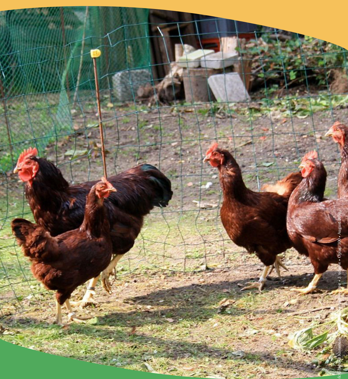
Layout: Kathrine Walsh og ME • Tryk: Gladsaxe Kommune, Tryk: Gladsaxe Kommune, Tryk: Gladsaxe Kommune • 3. udgave • Oplag: 100 • August 2019

Gladsaxe Kommune Miljøafdelingen Rådhus Allé 7 2860 Søborg