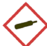
Gasser under tryk