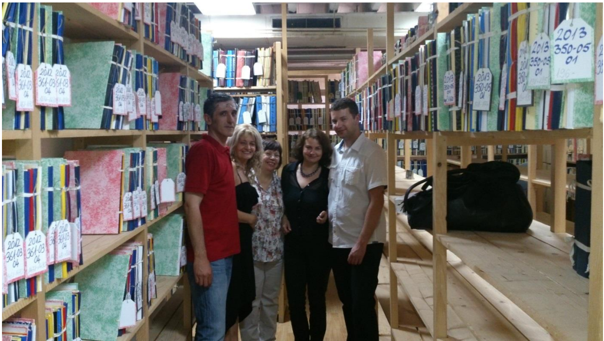
Byggesags arkivet, arkivfolkene fra Split og Gorica fra Gladsaxe Byarkiv

I Danmark bruger de fleste kommuner en fælles journalplan, som bliver fremstillet af Kommunernes landsorganisation. Split kommune modtager en overordnet journalplan fra Statens arkiver, som kommunen så retter til så den passer til deres sagsområder. Herefter skal journalplanen, som er tilrettet af kommunen, godkendes af Statens arkiv inden den kan tages i brug. Det er Statens arkiv i Split, som fører det overordnede arkivtilsyn med Split kommune.