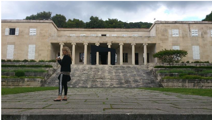
Ivan Mestrovic museum

Vi besøgte kunster Ivan Mestrovic museum. Han var skulptør som har haft stor betydning for Split. Han har bl.a. skabt en statue af Biskop Grgur Ninski, som er et symbol på frihed for byen. Efter sigende skulle det bringe held at berøre den ene guldtå på figuren af Biskop Grgur Ninski.