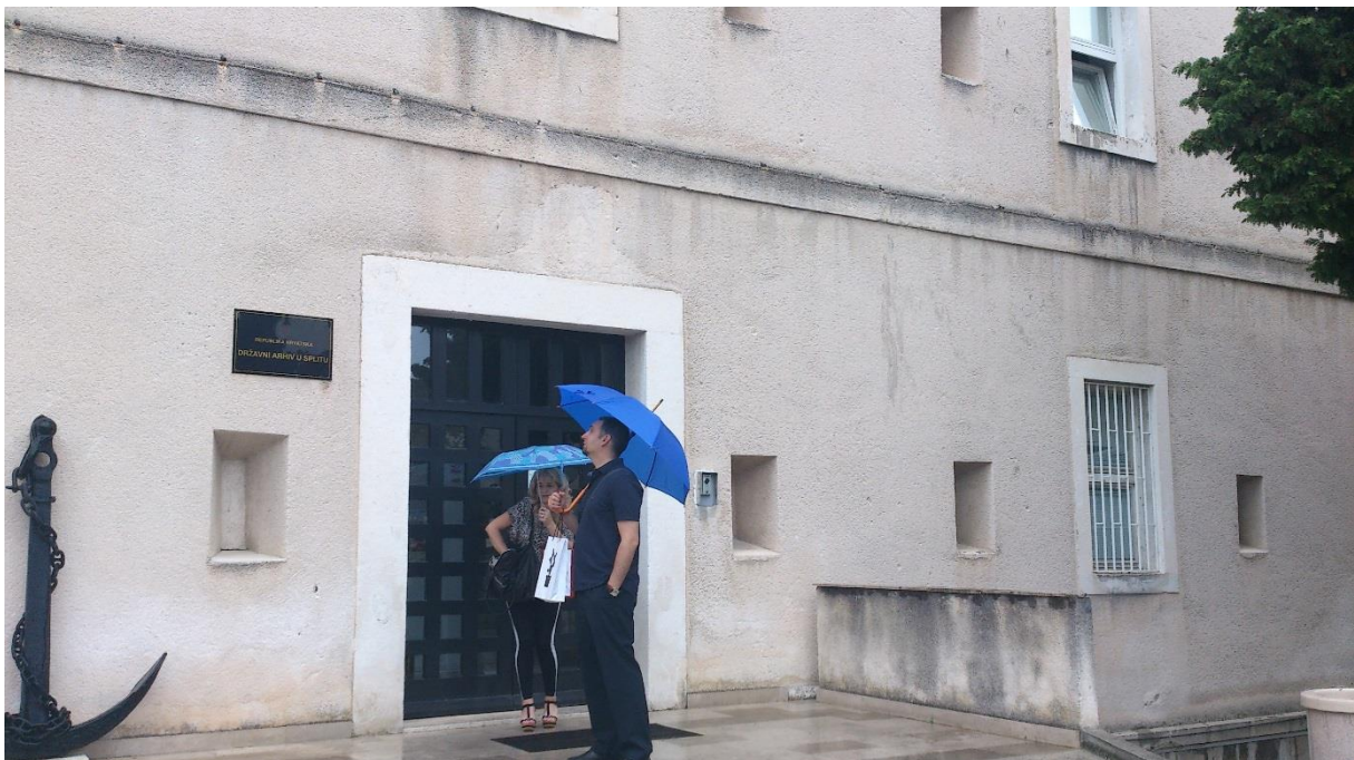
Statens arkiv i Split.

I en tredje enhed driver de selv magasinerne og får her opstillet arkivalierne. Vi blev her bl.a. præsenteret for en kirkebog fra 1504, som var blevet konserveret og efterfølgende pakket ind i en passende arkivkasse. Det var en fornøjelse, at vi iført hvide handsker, fik lov til at bladere i denne Kirkebog. De fleste arkivalier på arkivet er skrevet på latin, italiensk og tysk. Så det har været et krav til arkivarerne at de var historie uddannet og kunne italiensk.