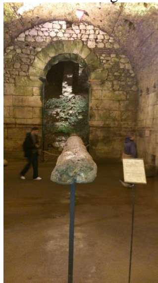
Udgravning under Split