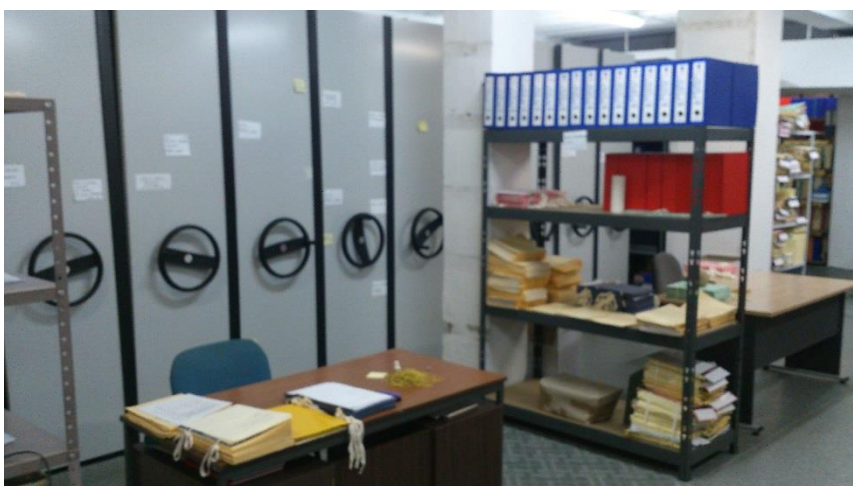
Det administrative arkiv i Split Kommune

I Danmark bruger de fleste kommuner en fælles journalplan, som bliver fremstillet af Kommunernes landsorganisation. Split kommune modtager en overordnet journalplan fra Statens arkiver, som kommunen så retter til så den passer til deres sagsområder. Herefter skal journalplanen, som er tilrettet af kommunen, godkendes af Statens arkiv inden den kan tages i brug. Det er Statens arkiv i Split, som fører det overordnede arkivtilsyn med Split kommune.