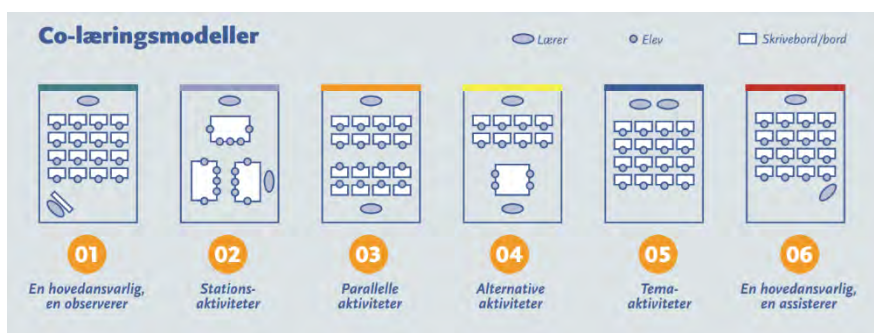
Fra arbejdshæftet Nest møder dagtilbud udviklet af PPR i Aarhus

Der er ikke på nuværende tidspunkt igangsat forskning til at følge op på erfaringerne på at implementere Nest i dagtilbud.