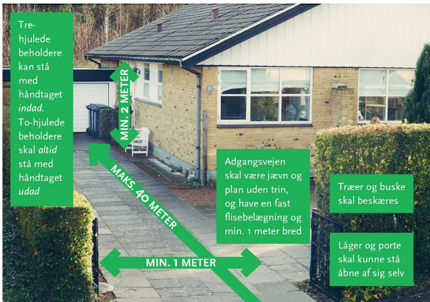
Figur: korrekt standplads og adgangsvej

På adgangsvejen skal der være en frihøjde, så renovatøren uhindret kan hente beholderen. Frihøjden skal mindst være 2 meter i højden. Der må være én låge eller dør på adgangsvejen, og denne skal kunne betjenes i oprejst stilling og kunne stå åben ved egen hjælp.