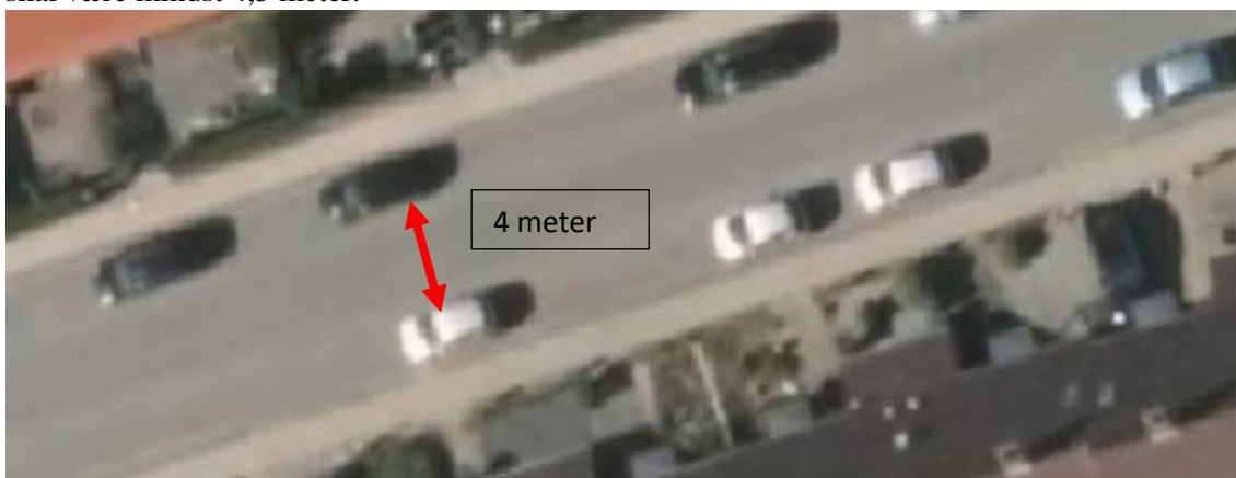
Figur: korrekt fribredde.

Tilkørselsvejen skal være mindst 4 meter i fribredden, det vil sige, at når der er parkeret biler, skal der mindst være 4 meter i bredden, mellem de parkerede biler, og frihøjden under grene og lignende hindringer skal være mindst 4,5 meter.