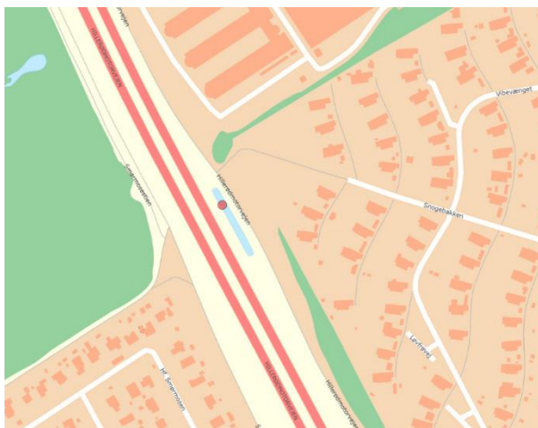
Figur 1 Oversigtskort over projektområdet.

Bassinet er på ca. 660 m 2 og er beliggende på matrikel 7000t, Gladsaxe. Matriklen ejes af Vejdirektoratet. I ansøgningen omtales bassinet som: Bassin 13-0 10/0900 H.