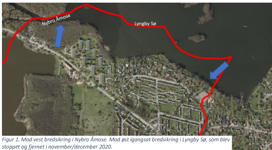
Figur 1. Mod vest bredsikring i Nybro Åmose. Mod øst igangsat bredsikring i Lyngby Sø, som blev stoppet og fjernet i november/december 2020.

Bredsikringen er foretaget på matr. nr. 84, Bagsværd i Gladsaxe Kommune.