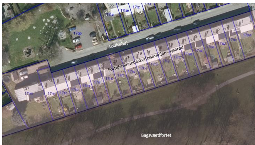
Figur 1. Louisehøj nr. 1-37. Fortidsmindebeskyttelseslinje er markeret med lyserød.

Rækkehusbebyggelsen der er beliggende på Louisehøj 1-37, 2880 Bagsværd er opført i 1952. Afgørelsen vedrører matr.nr. 17rx Bagsværd.