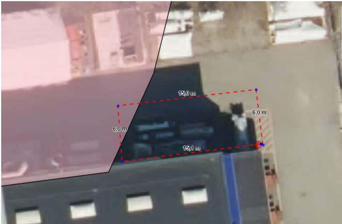
Figur 2. Ny placering af halvtag - kun lille overlap med fortidsmindet