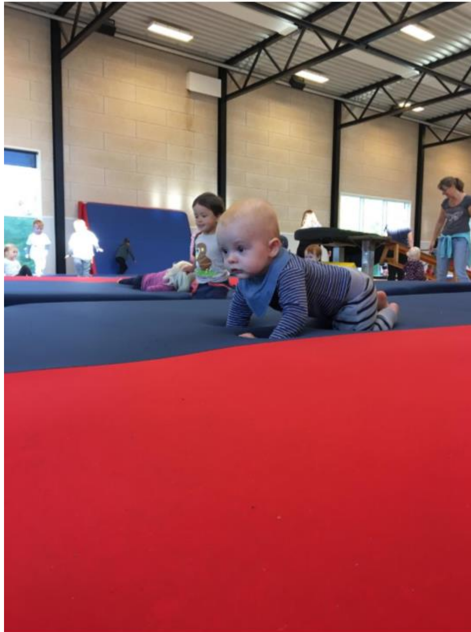
Gladsaxe Gymnastik- og Bevægelsescenter Danmarks gladeste sted