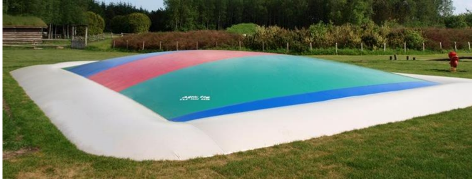
Billede fra Gladsaxe svømmehal