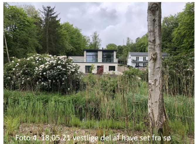
Foto 4. 18.05.21 vestlige del af have set fra sø