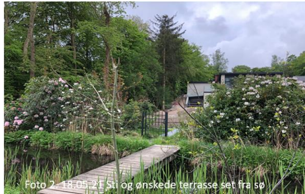
Foto 2. 18.05.21 Sti og ønskede terrasse set fra sø