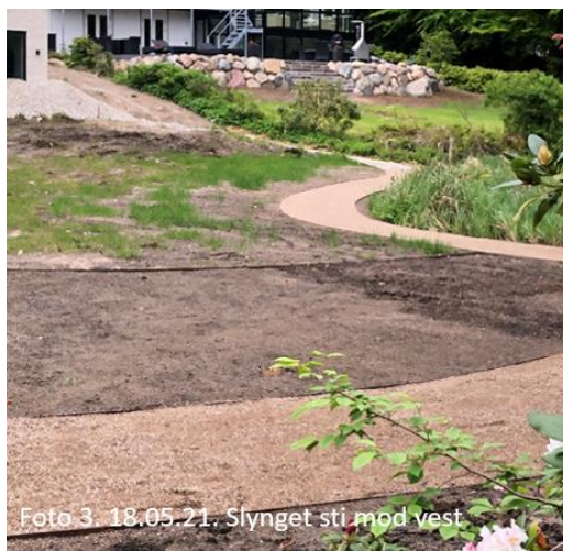
Foto 3. 18.05.21. Slynget sti mod vest