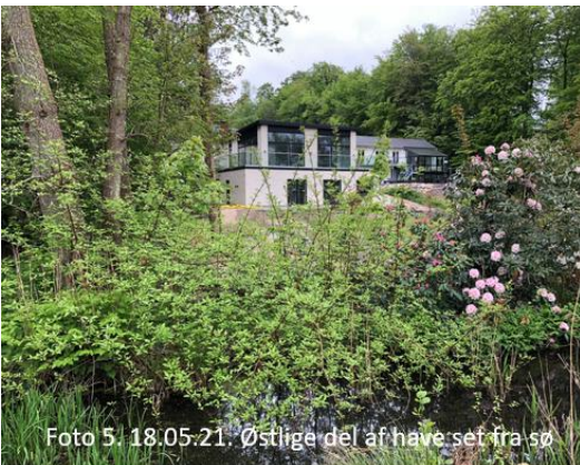
Foto 5. 18.05.21. Østlige del af have set fra sø