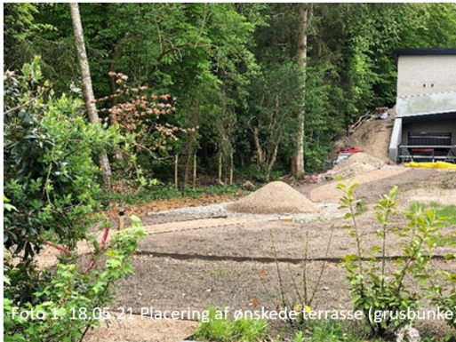
Foto 1. 18.05.21 Placering af ønskede terrasse (grusbunke)