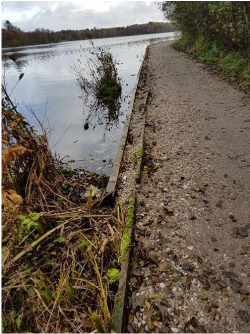
Figur 3. Ny bredsikring

Der er banket H-jern langs med den gamle kant, som skal holde de brædder/planker der sikrer at stien ikke bliver skyllet ud i søen. Brædderne skal derfor ikke skrues fast i en nedbanket træstolpe, hvilket skulle lette udskiftningen af de langsgående planker/brædder, når de med tiden bliver ødelagt eller rådner. Det har ifølge Byafdelingen, været mest hensigtsmæssigt at etablere den nye bredsikring på ydersiden af den gamle, for at minimere påvirkning af søbund og bred. Derved er stien blevet udvidet.