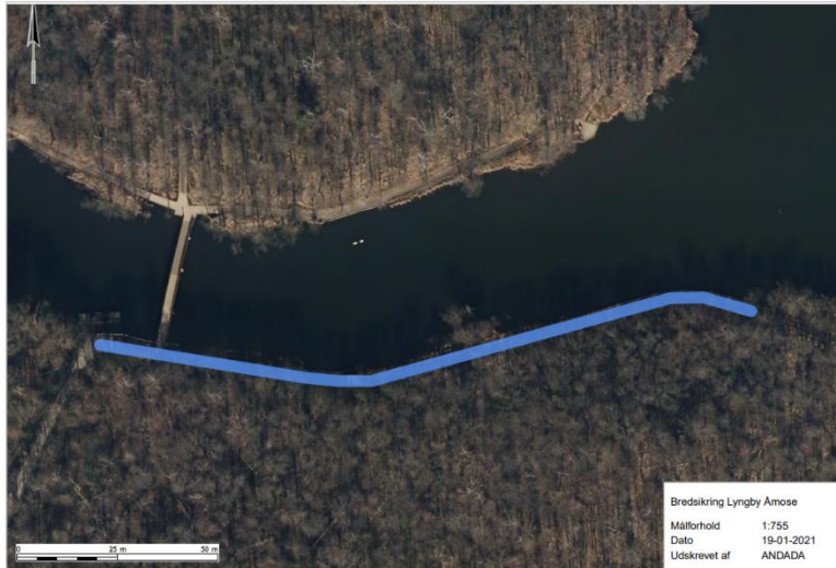
Figur 2. Strækningen hvor der er foretaget bredssikring vist med blå.

Gladsaxe Kommunes Byafdeling har i foråret 2019 renoveret og fornyet bredssikring på dele af ydersiden af den sti der løber langs Nybro Åmose.