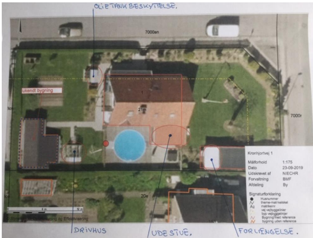
Kortudsnit fra kommunens webkort