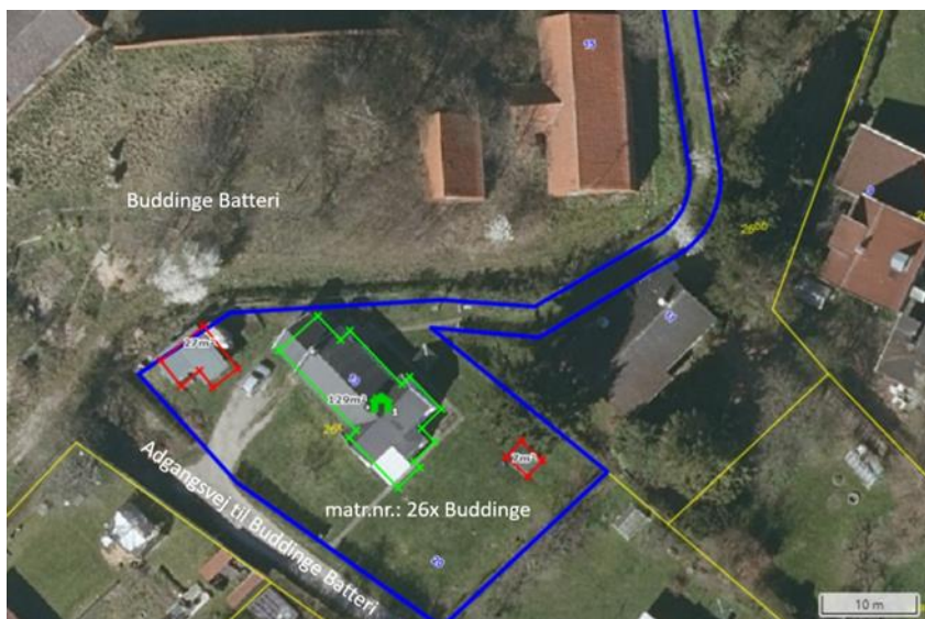
Figur 1. Oprindelige villa med omkringliggende bygninger

Der søges også om nedgravning af tank til regnvand, jordvarmeanlæg samt udskiftning af stikledninger for hhv. el, vand og kloak. Nærmere informationer ses af bilag 3.