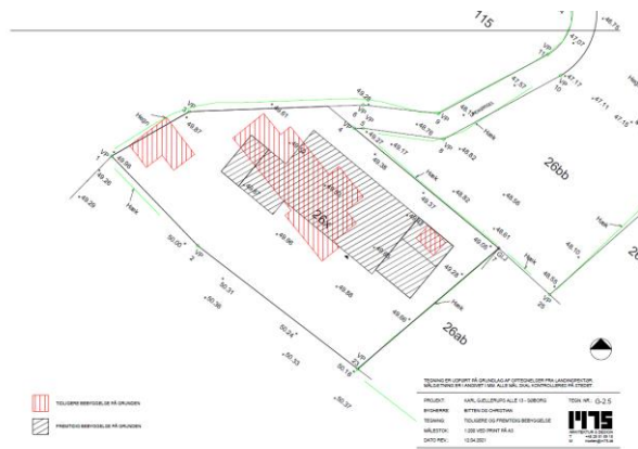
Figur 2. Ønsket opførelse af villa med overdækkede arealer