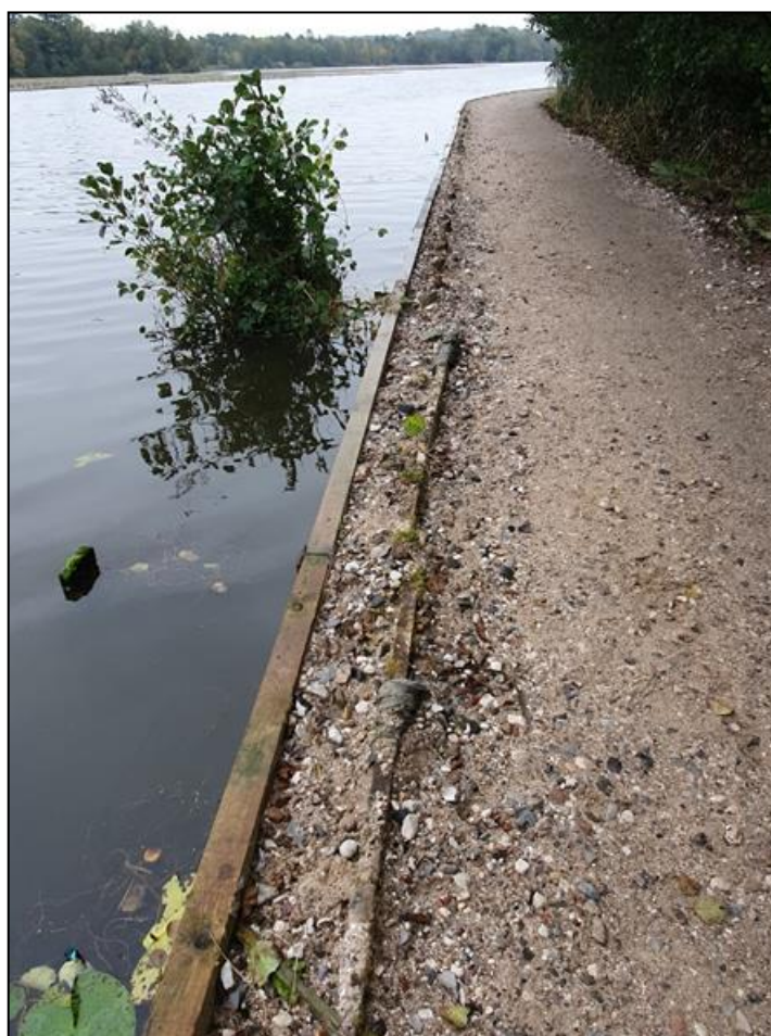
Figur 5: Foto af den renoverede brinksikring. Den nye brinksikring er sat ca. 20 cm uden for den gamle brinksikring og mellemrummet er fyldt op med grus. Foto er taget ved besigtigelse af strækningen den 28. oktober 2020.