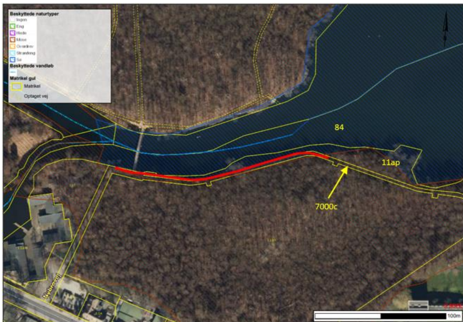
Figur 2: 2020 luftfoto. Den røde linje markerer strækningen langs Mølleåen, hvor der er foretaget renovering af brinksikringen. Beskyttede naturtyper er vist med signaturforklaring i øverste venstre hjørne. De gule streger angiver matrikelskel. Målestok er angivet i nederste højre hjørne. Indeholder data, som benyttes i henhold til vilkår for brug af danske offentlige data.