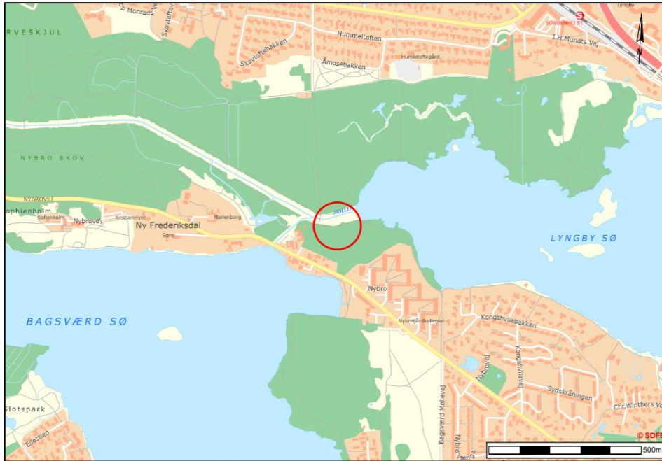
Figur 1: Oversigtskort. Den røde cirkel markerer området, hvor der er foretaget renovering af brinksikringen langs Mølleåen ved Nybro Åmose. Målestok er angivet i nederste højre hjørne.