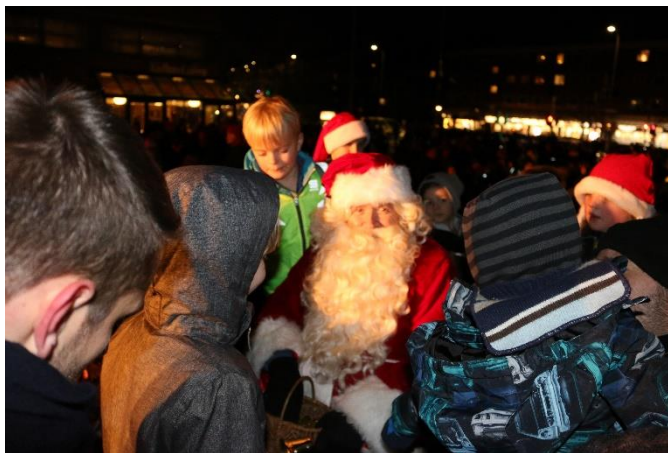
Julemanden på Rådhuspladsen 2019

Kultur, Fritid og Unge Gladsaxe Kommune December 2020