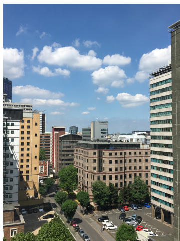
Udsigten fra vores hotel i Croydon