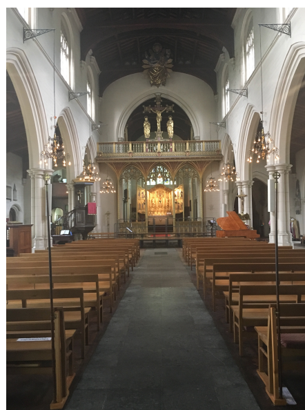
All Saint's Parish Church

Efter koncerten var der socialt samvær med Sutton Chorale i et nærliggende lokale på den lokale Village Club, inden vi kørte tilbage til hotellet og den sidste overnatning inden turen om søndagen gik tilbage til Gladsaxe.