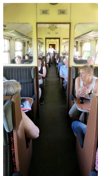
Bluebell Railway, udefra og indefra