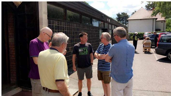
Hygge og socialt samvær

Vi havde lejet en bus under hele opholdet, og fredag startede vi med at køre med den til East Grinstead Station, hvorfra den såkaldte Bluebell Railway kører; Bluebell Railway er en veteranjernbane fra slutningen af 1800-tallet og begyndelsen af 1900-tallet. Toget kører gennem smukke engelske landskaber på en ca. 45 minutter lang tur til Sheffield Park Station; her er der mulighed for at se omkring 20 damplokomotiver, som er udstillet i remisen, heriblandt Bluebell, som har givet navn til jernbanen. Det var en ganske imponerende samling lokomotiver, som må være et sandt et eldorado for togentusiaster. Bluebell Railway har enkelte ansatte, og ca. 700 frivillige tilknyttet.