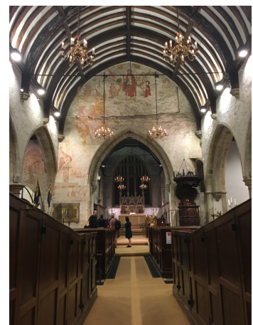
St. Denys' Church i Rotherfield