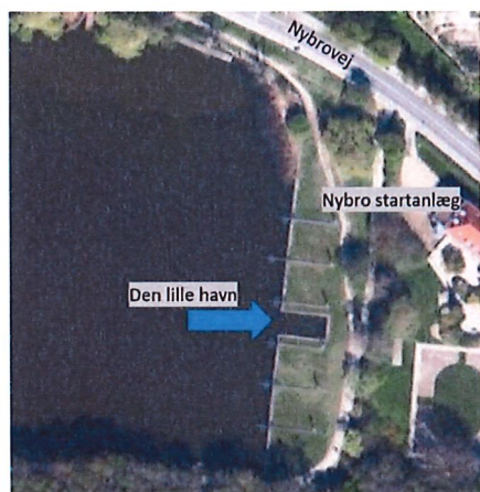
Figur 2. Den lille havn ved Nybro